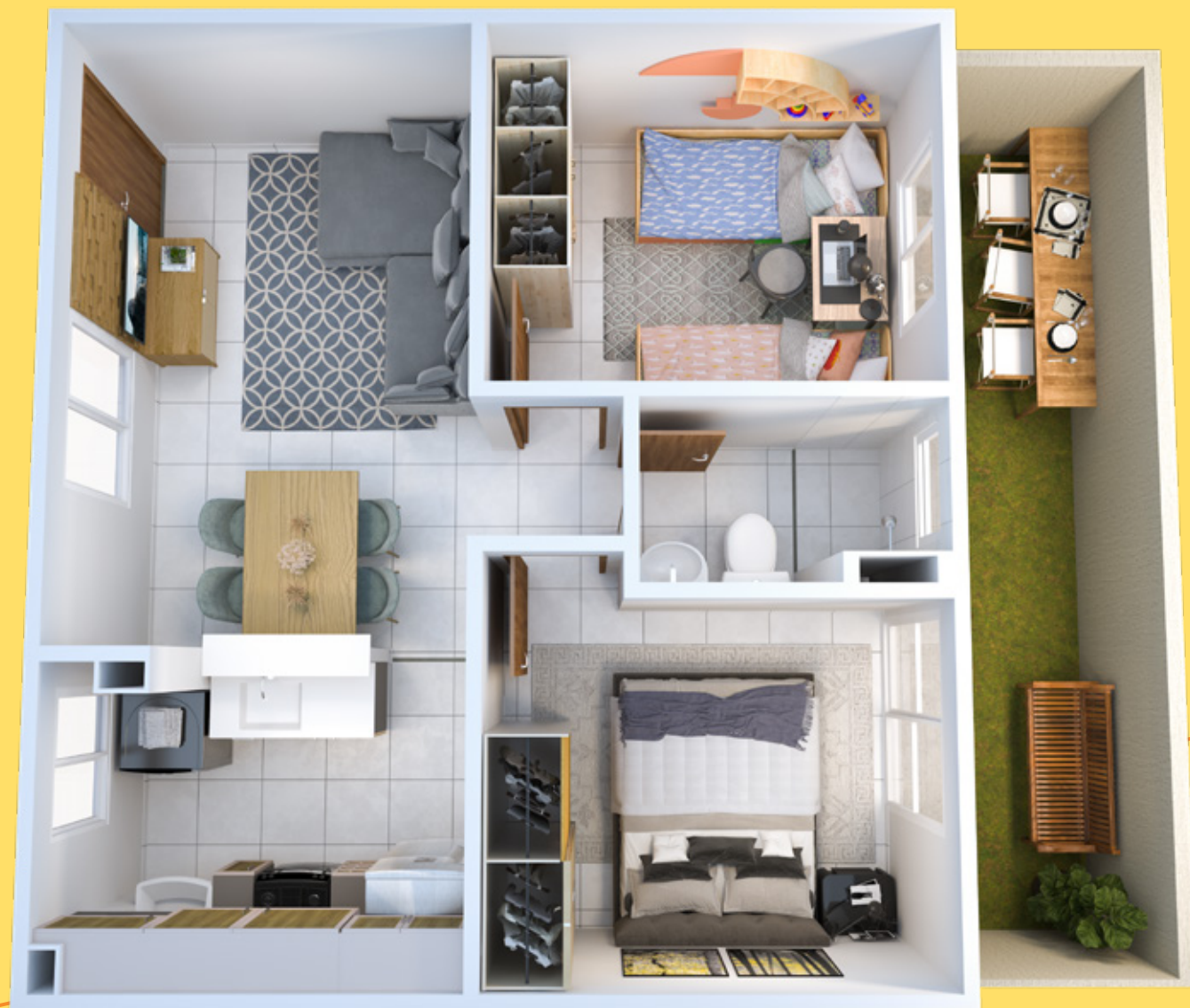
APTO. 104 • BLOCO 07