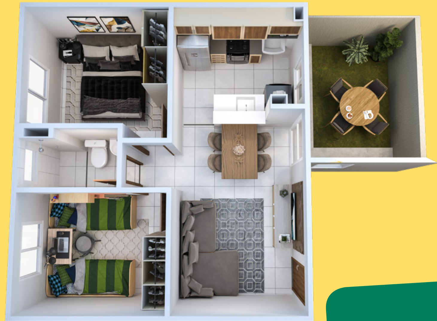
APTO. 101 • BLOCO 07