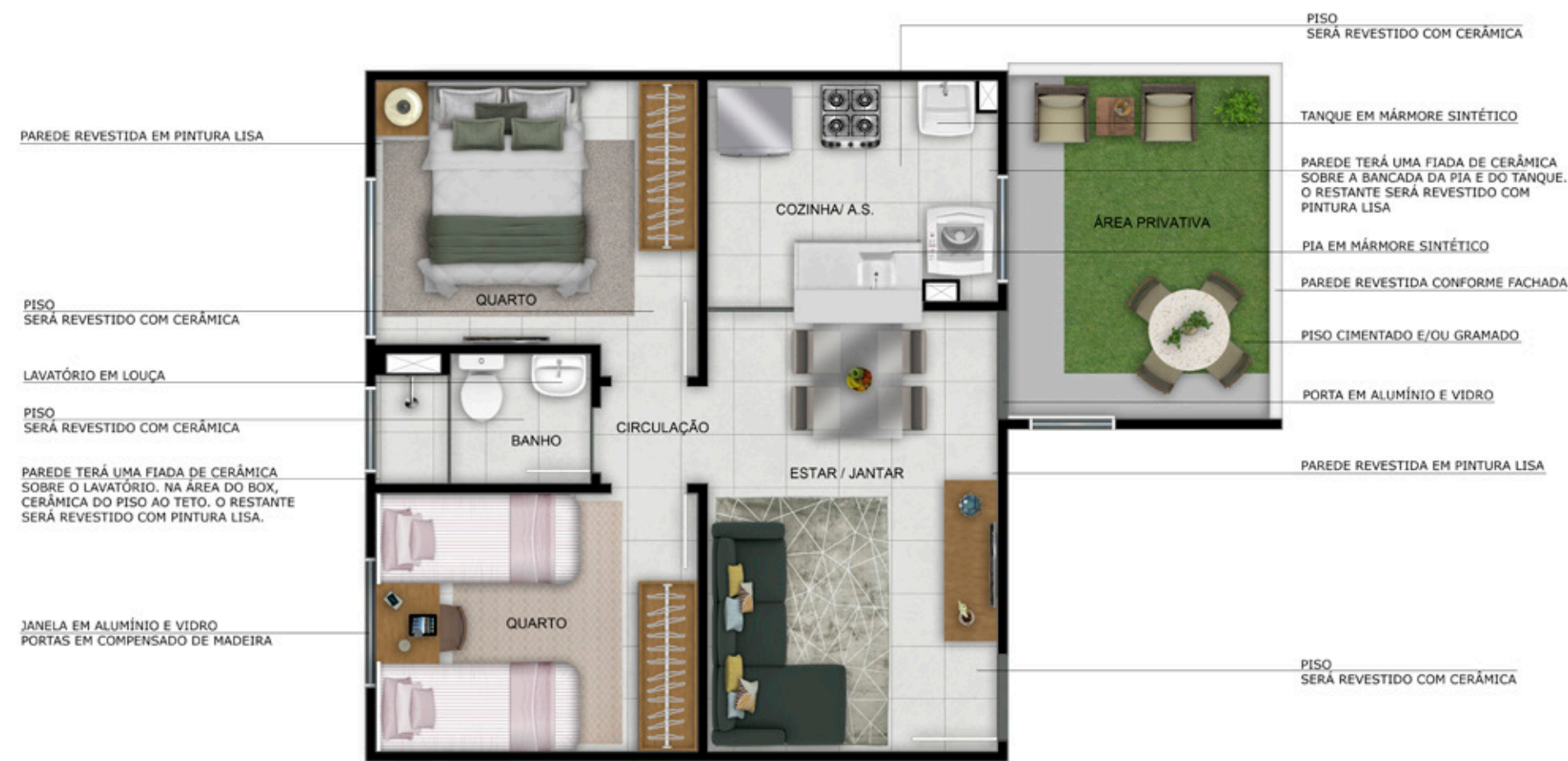
APTO. 101 • BLOCO 07