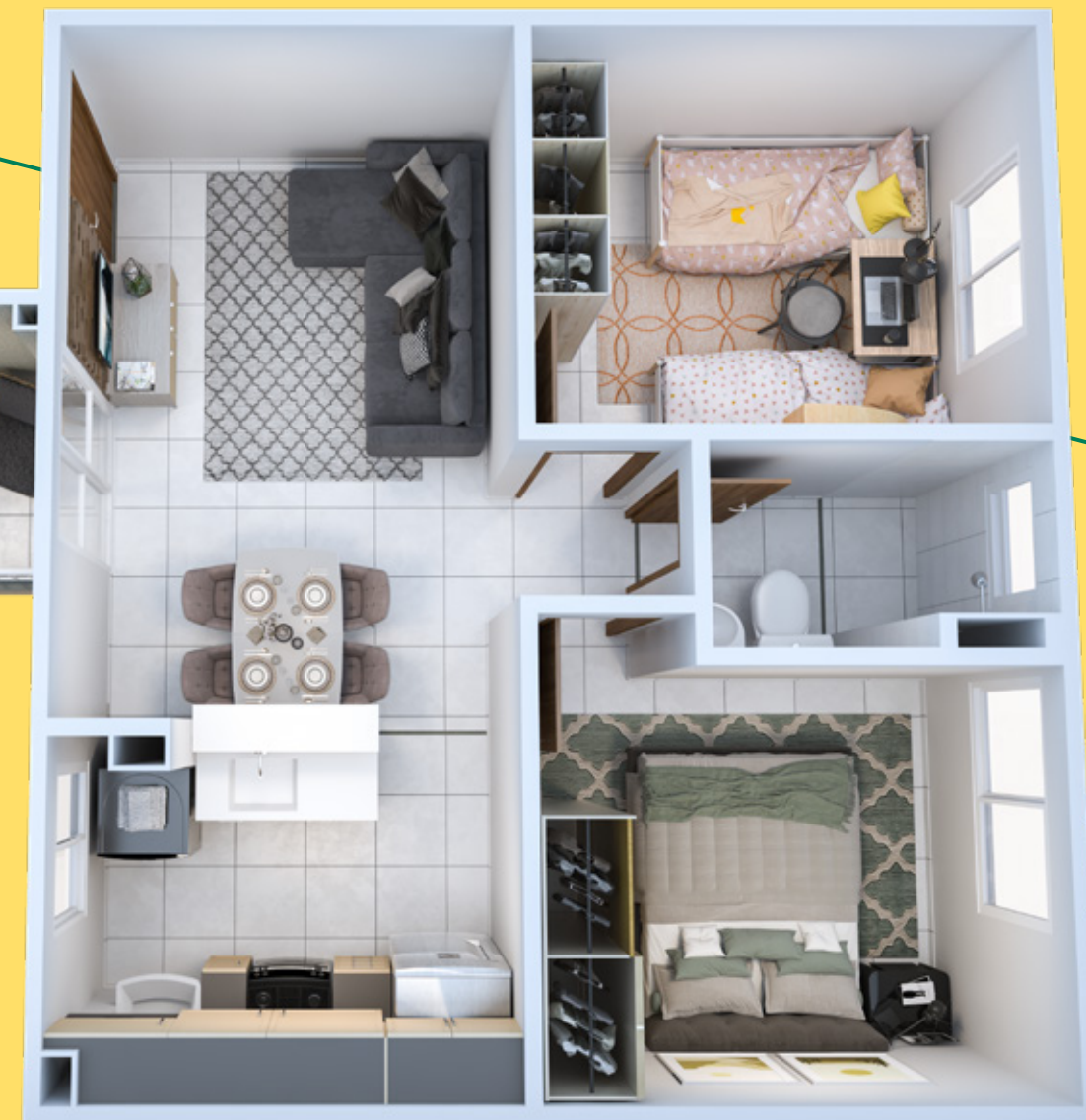
APTO. 204 • BLOCO 07