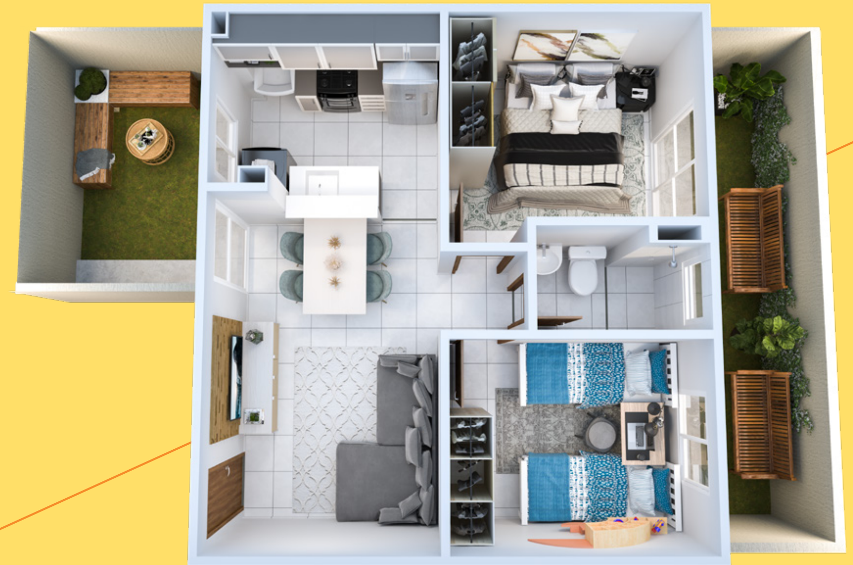
APTO. 103 • BLOCO 07

Ambientes planejados para fazer você feliz.