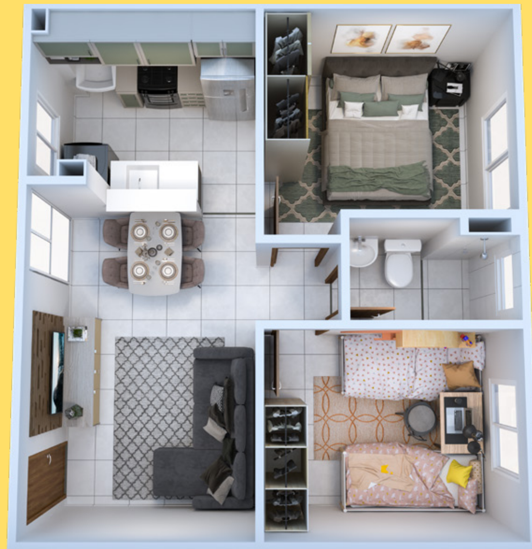
APTO. 203 • BLOCO 07