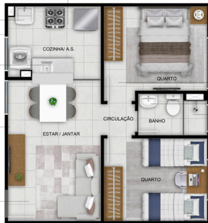
APTO. 203 • BLOCO 07